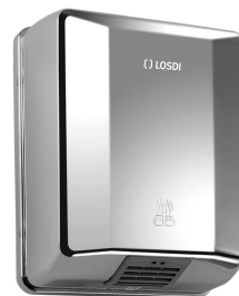
REF: CS-400-X Finition CHROME