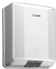
REF: CS-200-X Finition ABS BLANC