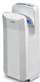
REF: CS-700-X Finition BLANC