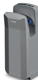
REF: CS-700-G/X Finition ARGENT